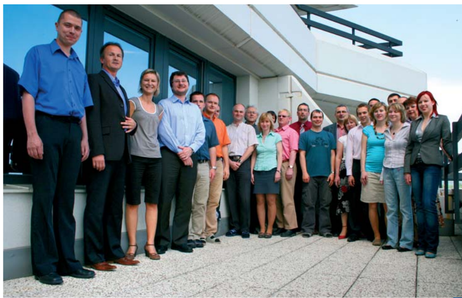
Úřad Regionální rady, pracoviště Olomouc