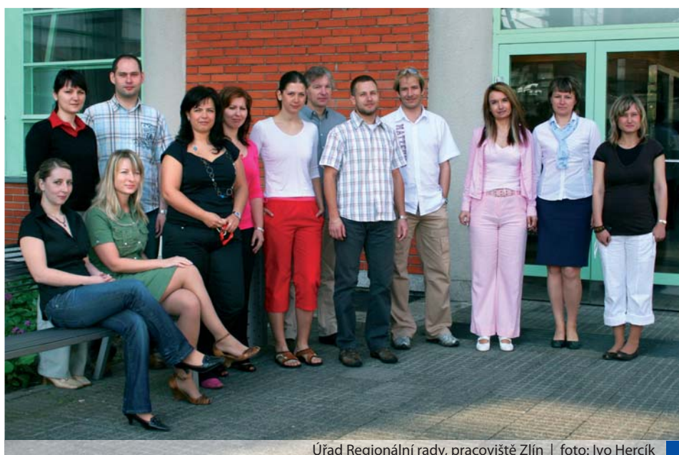
Úřad Regionální rady, pracoviště Zlín

Úřad Regionální rady je tvořen pěti odbory – Kancelář ředitele, Odbor řízení projektů (oddělení Olomouc a Zlín), Odbor kontroly a plateb (oddělení Olomouc a Zlín), Odbor metodiky a monitoringu (oddělení metodiky, monitoringu a evaluace, kontroly a nesrovnalostí) a Finančním odborem (oddělení finančního řízení, vnitřní správa). Nezávislým dohledem nad realizací ROP byl pověřen Útvar interního auditu. Agendu spojenou s Výborem Regionální rady zajišťuje tajemník předsedy a výboru.