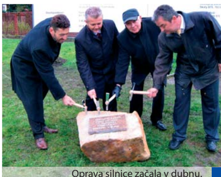
Oprava silnice začala v dubnu.

Bystřice pod Hostýnem – Přerovská ulice v Bystřici pod Hostýnem nabídne motoristům vyšší komfort, zlepší se i bezpečnost. Oprava asi 920 metrů dlouhého úseku silnice druhé třídy začala v dubnu, stavbaři práce ukončí ještě letos v srpnu. Rekonstrukce