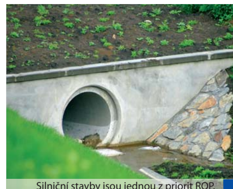
Silniční stavby jsou jednou z priorit ROP.