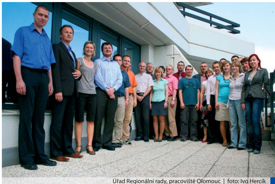
Úřad Regionální rady, pracoviště Olomouc