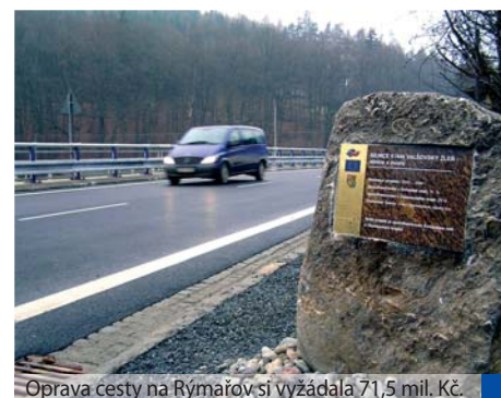
Oprava cesty na Rýmařov si vyžádala 71,5 mil. Kč.

Dalšími důležitými stavbami budou například oprava mostu a napřímení silnice u Štěpánova, kde silničáři osadí zcela nové mostní těleso, rekonstrukce silnice mezi Štěpánovem a Konicemi nebo výměna asfaltových vrstev mezi Lipníkem a Přáslavicemi.