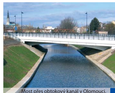
Most přes obtokový kanál v Olomouci.

Radnice mohly žádat o dotace jen na stavby, které přímo souvisely s krajskými investicemi. Předloženo bylo 26 projektů v celkové výši 1,044 miliardy korun. „Schválením 19 z nich bylo odstartováno čerpání peněz z Regionálního operačního programu ve Zlínském a Olomouckém kraji,“ uvedla Renata Škrobálková z Úřadu Regionální rady regionu soudržnosti Střední Morava. Investice do zvýšení kvality silnic zaznamenají motoristé již letos.