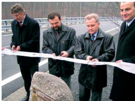
Otevření rekonstruované silnice na Rýmařov.

Olomoucký kraj – Odstranění nebezpečných míst na regionálních silnicích, stavby obchvatů a protihlukových stěn, úprava nebezpečných železničních přejezdů nebo zajištění kvalitního napojení na hlavní silniční tahy. To jsou jen některé z priorit, které si Olomoucký kraj vytkl v rámci zlepšování regionální infrastruktury. Díky Regionálnímu operačnímu programu začíná některé ze svých plánů již realizovat.