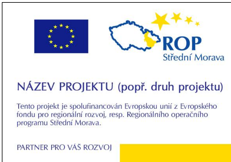
Obr. 2 – příklad zpracování informační cedule bez vizualizace