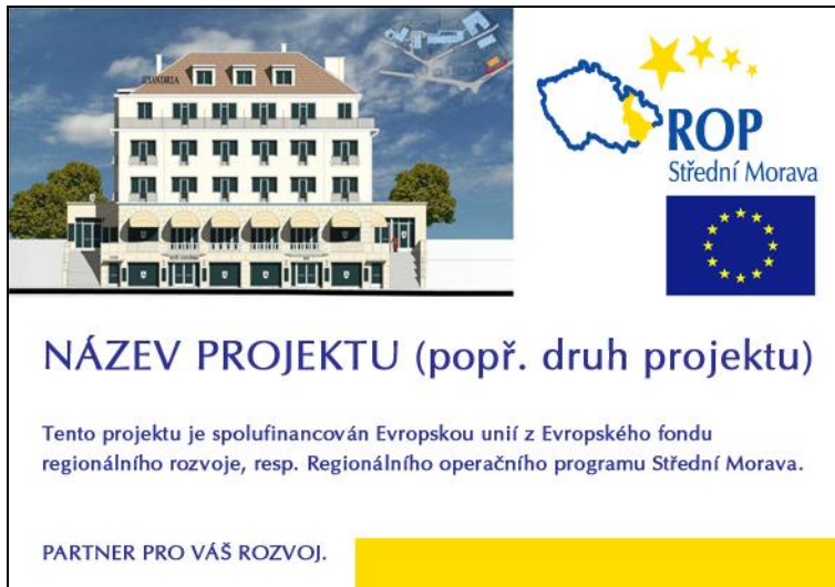
Obr. 1 – příklad zpracování informační cedule s vizualizací