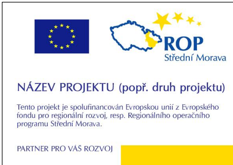
Obr. 2 – příklad zpracování informační cedule bez vizualizace