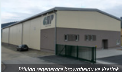
Příklad regenerace brownfieldu ve Vsetíně.

V současné době existuje pro účely podpory regenerace brownfields řada dotačních nástrojů. V rámci Regionálního operačního programu regionu soudržnosti Střední Morava se mohou zájemci se svým záměrem ucházet o podporu na revitalizaci lokalit brownfields v rámci oblasti podpory 2.4 Podpora podnikání.