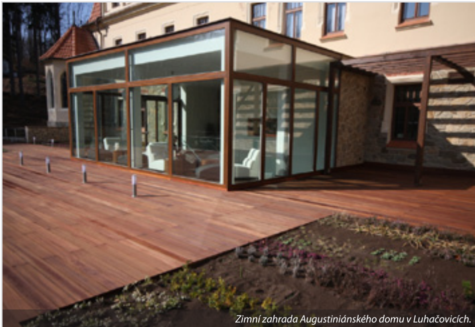
Zimní zahrada Augustiniánského domu v Luhačovicích.