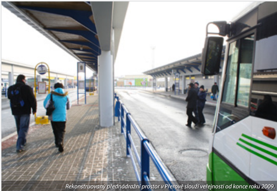
Rekonstruovaný přednádražní prostor v Přerově slouží veřejnosti od konce roku 2009.