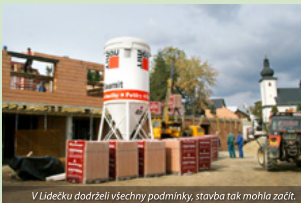
V Lidečku dodrželi všechny podmínky, stavba tak mohla začít.

tím, zda máte správně zvolené monitorovací indikátory – a to včetně jejich kvantifikace.