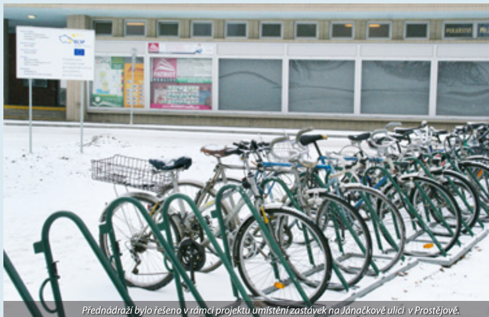
Přednádraží bylo řešeno v rámci projektu umístění zastávek na Jánačkově ulici v Prostějově.

Také požadavky jednotlivých poskytovatelů dotací se od sebe často velmi zásadně odlišují, a to nejen co do požadovaných náležitostí žádosti, ale například také uznatelnosti jednotlivých nákladů. Přepracovat proto například žádost o podporu na výstavbu cyklistické stezky z Regionálního operačního programu na žádost ke Státnímu fondu