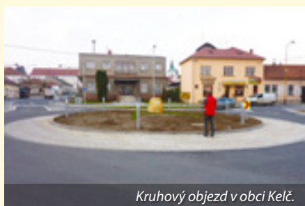
Kruhový objezd v obci Kelč.

Ve Zlínském kraji se snaží věnovat maximum finančních prostředků do rekonstrukce dopravní infrastruktury. Hejtmán Stanislav Mišák potvrdil, že do roku 2013 by chtěl kraj vyřešit vnitřní dluh vůči silnicím II. a III. třídy, ať už vlastními rekonstrukcemi nebo rozsáhlejšími opravami tak, aby byl stav těchto komunikací na ucházející úrovni.